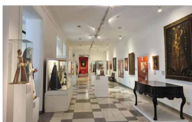
Museo de Arte Sacro

En sus salas se pueden observar diversas colecciones dedicadas a insectos, mariposas y escarabajos hasta grandes mamíferos y animales naturales de otros continentes. El museo también cuenta con un jardín botánico que expone la flora de la región. Entrada general con costo. Menores de 5 años, jubilados y pensionados, sin cargo.