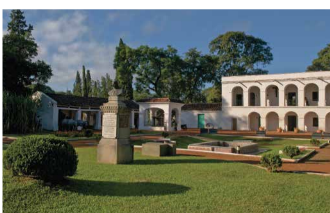
Museo de la Industria Azucarera

Situado en el Casco Histórico de la ciudad, se erige en la antigua casona donde nació Nicolás Avellaneda, presidente de Argentina entre 1874 y 1880. Su patrimonio está compuesto por armas, indumentaria, documentos y diferentes herramientas de uso agrícola. Entrada gratuita.