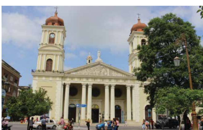
Iglesia Catedral Nuestra Señora de la Encarnación

Ubicado en el Casco Histórico de la ciudad, el museo resguarda piezas que reflejan los vínculos entre la historia y el arte de la Iglesia Católica y la sociedad tucumana, representada por la fusión de la cultura española y la indígena. En sus salas se pueden observar pinturas, esculturas, ornamentos de platería y mobiliario. Entrada general con costo. Menores de 12, gratis. Jubilados sin cargo los martes.