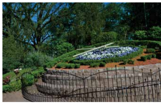
Parque 9 de Julio

Es uno de los templos más importantes de la provincia. Aquí se puede observar la imagen de la Virgen María en su advocación como Nuestra Señora de la Merced, nombrada generala del Ejército Argentino por el General Manuel Belgrano.