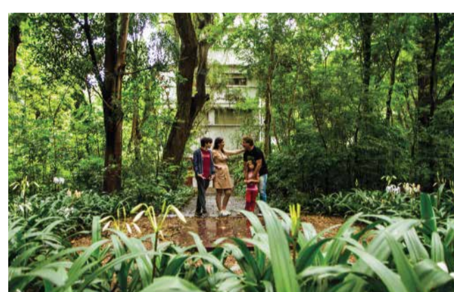
Museo Miguel Lillo de Ciencias Naturales

Se encuentra dentro del Parque 9 de Julio, se erige en la casona de 1800 donde vivió el obispo José Colombes, referente del cultivo de la caña de azúcar en Tucumán. En su interior se exhiben maquinarias utilizadas a lo largo de la historia para la elaboración del azúcar y un antiguo trapiche de madera. Entrada gratuita.