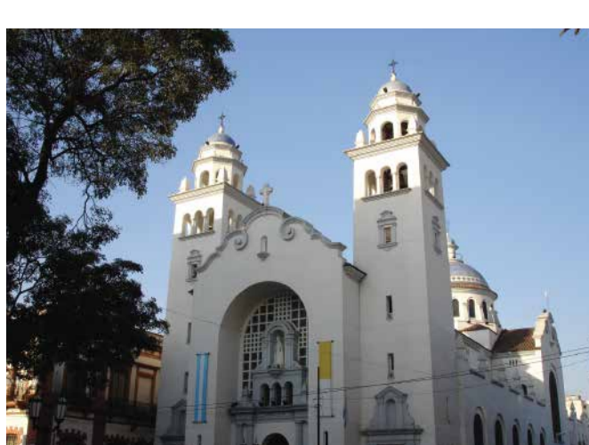
Basílica de Ntra. Sra. de la Merced

Nombrada Basílica Menor de Nuestra Señora del Rosario, el templo resguarda la imagen de la Virgen del Rosario traída desde el primer asentamiento de la ciudad en Ibatín.