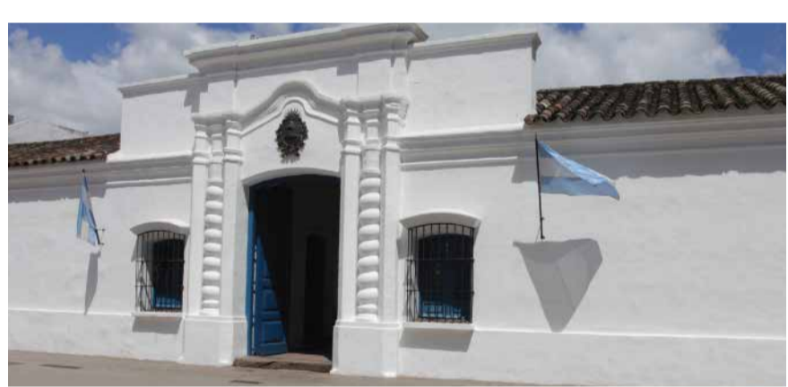
Museo Casa Histórica de la Independencia

Es el museo más importante del país al haber sido testigo del Congreso donde se declaró la Independencia Argentina el 9 de Julio de 1816. La información se exhibe a través de una propuesta interactiva que propone aprender historia de manera lúdica para todas las edades. Se puede visitar de manera gratuita en días y horarios que varían según la época del año.