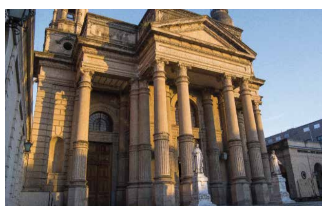
Iglesia San Domingo

Ubicada frente a la Plaza Independencia en el Casco Histórico de la ciudad, es la iglesia matriz de San Miguel de Tucumán. Entre sus principales reliquias se encuentra la Cruz Fundacional, el órgano traído de París en 1800 y sus frisos que relatan la creación del mundo.