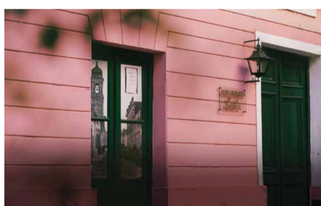
Museo Histórico Provincial

Situado en el Casco Histórico de la ciudad, se erige en la antigua casona donde nació Nicolás Avellaneda, presidente de Argentina entre 1874 y 1880. Su patrimonio está compuesto por armas, indumentaria, documentos y diferentes herramientas de uso agrícola. Entrada gratuita.